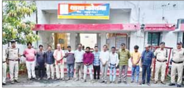
अपराध न करने की टी सख्त हिदायत